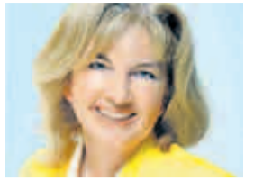
VON PETRA GÖTZE